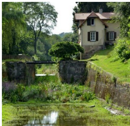
Vallée des éclusiers

Le nombre d'écluses dans notre vallée des éclusiers (17 comme chacun le sait) coïncide, comme nous l'avons déjà mentionné dans une précédente lettre du Codev, avec les 17 Objectifs de Développement Durable de l'O.N.U. Et bien sûr, ce sera le prétexte pour partager à nouveau en 2023 les mesures proposées par nos collectivités pour les mettre en œuvre sur notre territoire. Quel bel écrin que cette vallée qui lutte déjà pour protéger sa biodiversité et redonner vie à son patrimoine ! Mais une telle entreprise doit se préparer longtemps à l'avance ; alors en accord avec la Communauté de Communes du Pays de Phalsbourg et avec le concours d'associations et d'habitants du territoire que nous allons rallier à notre cause, nous allons dès cet automne entamer l'étude de sa mise en œuvre. Nous aurons besoin de vous pour réussir ce beau projet. Alors si la cause vous paraît belle et que vous vous en sentiez le courage, rejoignez le groupe de travail que nous allons lancer. Signalez au plus vite votre souhait de vous joindre à l'équipe projet prochainement formée.