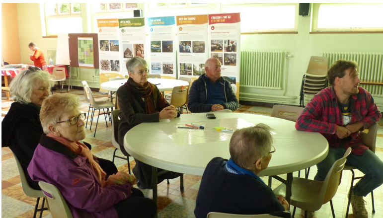
Une groupe de participants prend connaissance des règles de fonctionnement de l'atelier