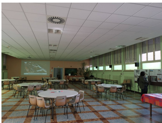
La salle de conférence du couvent prête à recevoir le public pour l'atelier sur l'avenir du couvent – large revue de presse affichée sur les panneaux de droite et disponible sur les tables à l'entrée de la salle